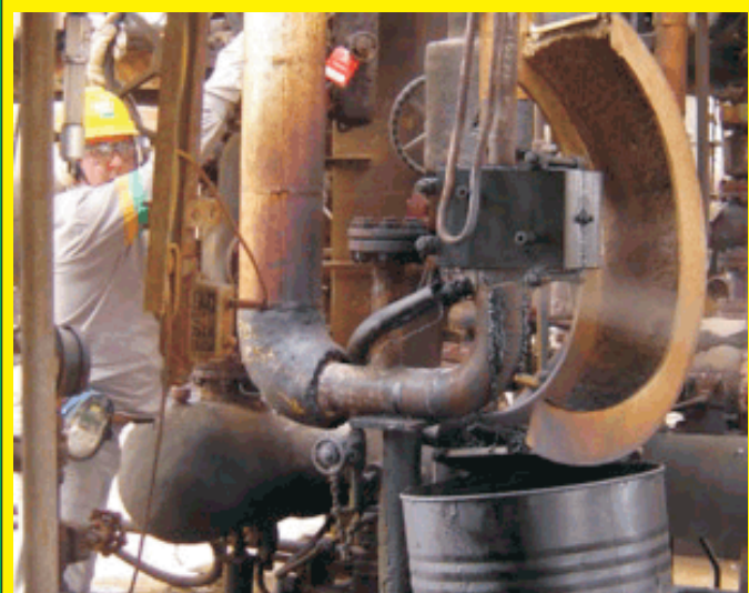
Precarização e vazamentos em unidade da PETROBRÁS - RLAM