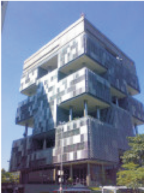
EDISE - PETROBRÁS

Participe da ENQUETE e Abaixo Assinado pela CPI na Gestão da PETROBRÁS