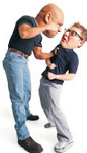
Quem denúncia é perseguido!

Outra situação também prevista na CPI é a investigação de diversos contratos sem licitação executados pela gestão da PETROBRÁS. Por falta de