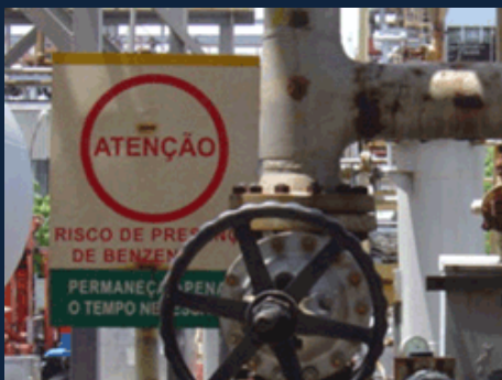
Presença de benzeno na RLAM

Nesta semana acontecerão novas audiências em Santo Amaro contra a administração da Refinaria Landulfo Alves.