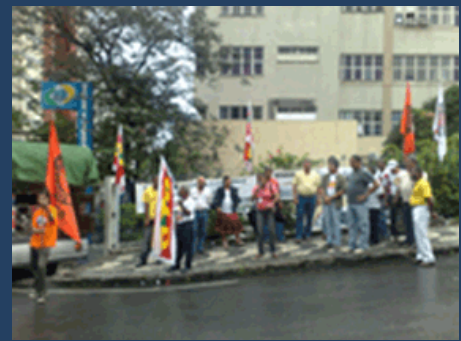
Ato público na porta do INSS

As Centrais Sindicais na Bahia pretendem fazer uma mobilização maior devido o aumento de irregularidades. Clique aqui para detalhes da matéria do jornal da Metrópole.